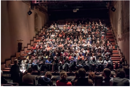
La Chartreuse

该建筑现在用于艺术家居住，因为其结构严谨，中间都是露天的空间，既适合一个人单独生活也适合群体活动。