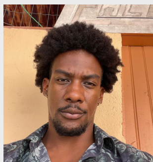
Giovanni Germany © DR

Dans un contexte de crise majeure en Martinique, La Vaillante met en scène la violence de l'effondrement d'une société brutalement coupée du reste du monde. Alors que toutes les communications extérieures sont interrompues, l'île plonge dans le chaos : pénurie alimentaire, violences, répressions et luttes de pouvoir fracturent la population. Cette fracture se répercute sur Kenny et Albane. Deux âmes liées que divise leur vision du monde.