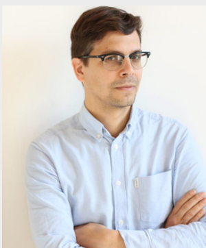
Mathieu Kleyebe Abonnenc

Expositions collectives récentes: Chaque vie est une histoire , Palais de la porte dorée, Paris, Avant-Garde and Liberation. Contemporary Art and Decolonial Modernism , Mumok, Vienne, (2024), Sarah Maldoror, un cinéma tricontinental , Palais de Tokyo, Paris (2021), Le déracinement , Z33, Hasselt (2021), Manifesta 13 , Marseille (2020), Que fût 1848 ? Frac Nord Pas-de-Calais, Dunkerque, Stories of Almost Everyone , Hammer Museum, Los Angeles; (2018) Jiwa , Biennale de Jakarta, The Conundrum of Imagination , Leopold Museum, Vienna, Los Multinaturalistas , MAMM Medellin, (2017) All the World's Futures , Pavillon international de la 56e Biennale de Venise, (2015)