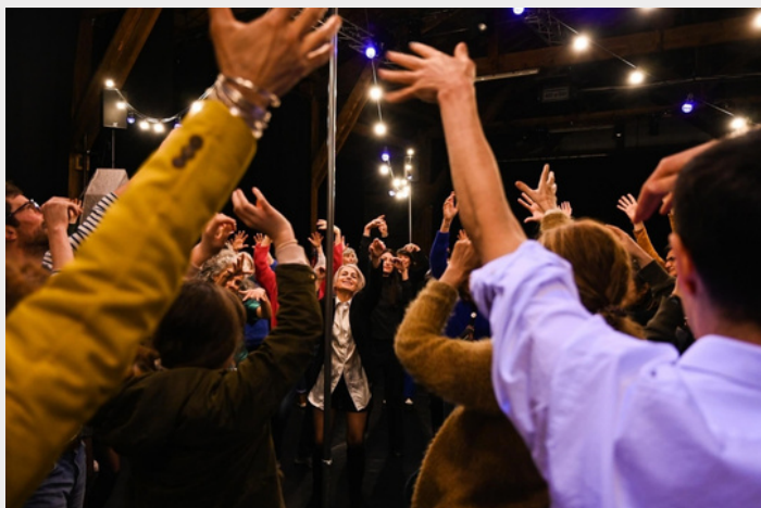
Bal Magnétique