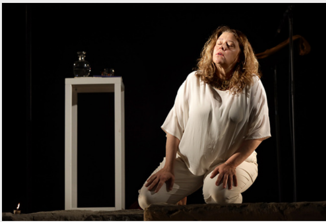
Ismene © Marie Clauzade