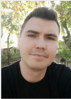
Ihor Nossovsky © DR

Les Post-it nous plonge dans un petit appartement situé dans une ville occupée, où cohabitent une fille et sa mère âgée. Les frontières entre réalité et souvenirs s'estompent peu à peu : la mère est piégée dans l'obscurité de sa mémoire défaillante, tandis que la fille sombre dans l'obscurité physique et morale de la ville occupée. À travers ce huis clos poignant, la pièce explore l'impuissance des individus face à la guerre, les décisions morales inacceptables qu'elle impose et la solitude qui s'empare des plus vulnérables. Une exploration intime et percutante de l'impact de la guerre sur les mondes intérieurs et les fragiles repères humains.