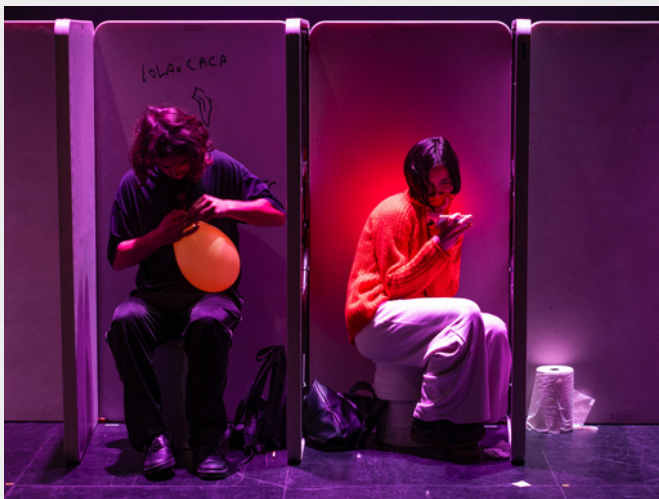
Teen Play