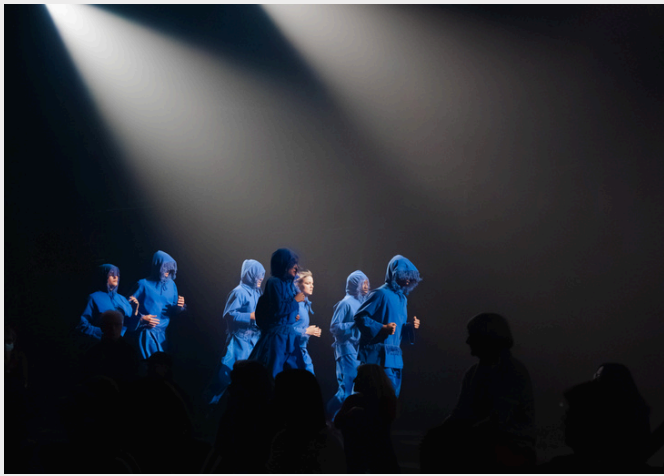
La Tendresse du ventre de la baleine © Julie Folly