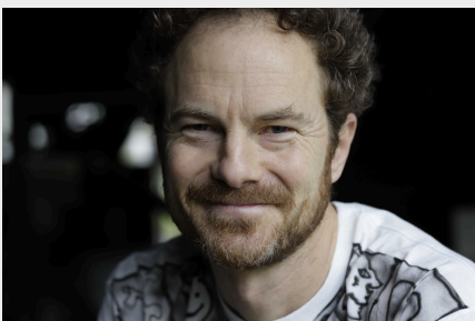
Boris Charmatz

Avec l'aide de la Briqueterie CDCN du Val-de-Marne, le Centre Pompidou - Metz, Espace Pasolini