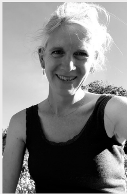
Samaele Steiner

Samaële Steiner nous livre une fable onirique queer qui dit en chœur l'importance de l'amitié et l'apprentissage de la liberté à l'adolescence. Une pièce vibrante emplie de sororité, de courage et d'espoir qui appelle à rêver grand en essayant de n'avoir ni peur ni honte de qui on est.